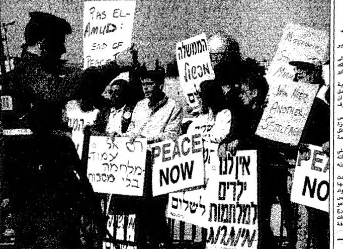
انضمام من حركة السلام والتظاهر في قراة الحكومة من وحدات سكنية في رأس العامود (روبرت)

■ لندن - في إقبات مسفرة عربية في لندن في الزعيم الوطني لحركة المقاومة الإسلامية حماس، الشيخ أحمد ياسين مع مسؤولين في الخارجية البريطانية في زيارة إلى بريطانيا لمناقشة الوضع الفلسطيني في الضفة الغربية.